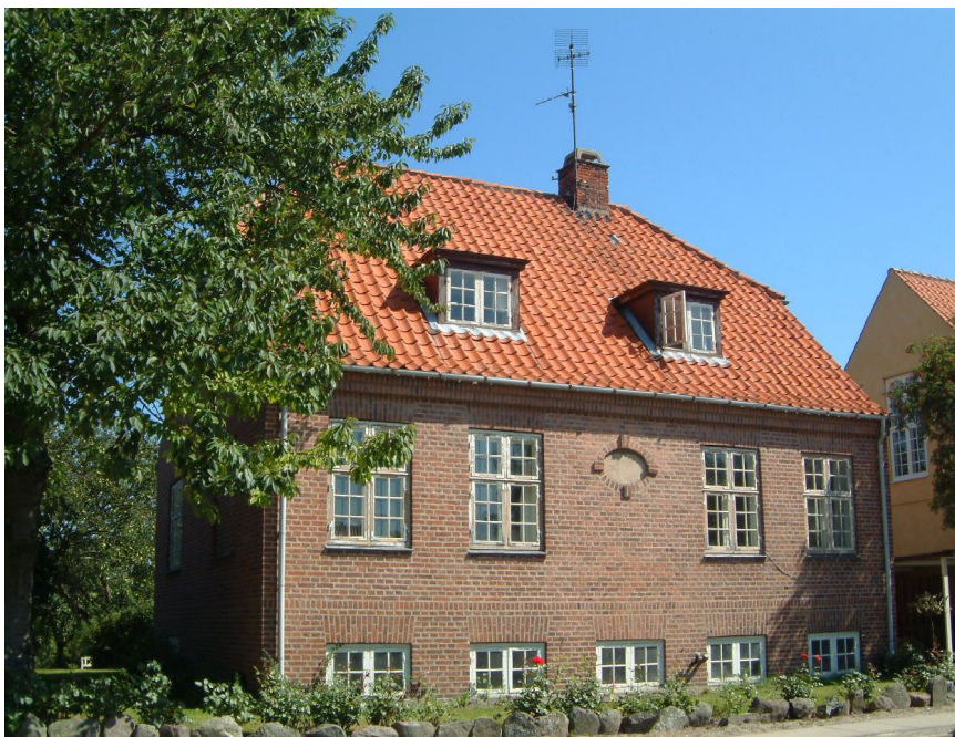
Den energirenoverede villa

Inden energirenoveringen havde villaen et registreret bruttoenergiforbrug på 332 kWh/m 2 ved en indendørs temperatur på 20°C. Ved renoveringen blev opnået en reduktion på næsten 50 % om året