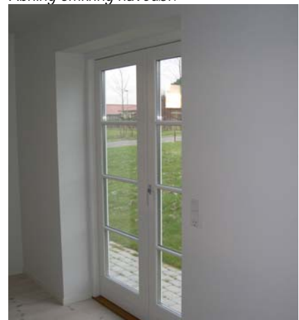
Åbning omkring havedør.